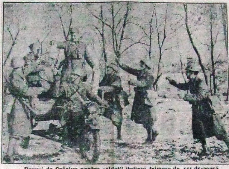
Daruri de Crăciun pentru soldații italieni, trimise de cei de-acasă